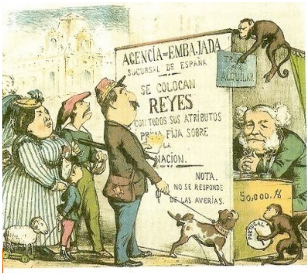
Caricatura de la revista La Flaca (1869). Isabel II, con su familia y el pretendiente carlista buscando trabajo.